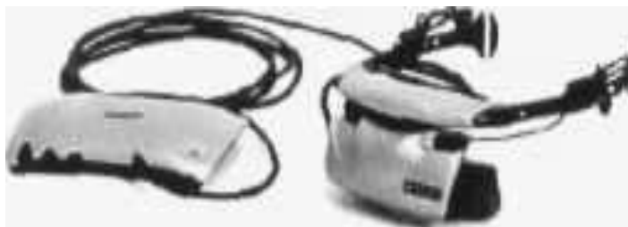
Рис. 2. Шлем Z 800 (внешний вид).

Мы не будем в данной статье обсуждать все полученные результаты, отметим лишь одно направление в мышлении испытуемых, которое выступило достаточно рельефно. Оказалось, что трехмерное изображение компонентов задачи влияет на характер осуществляемого мыслительного процесса. У испытуемых после предъявления подсказки значительно расширилась зона